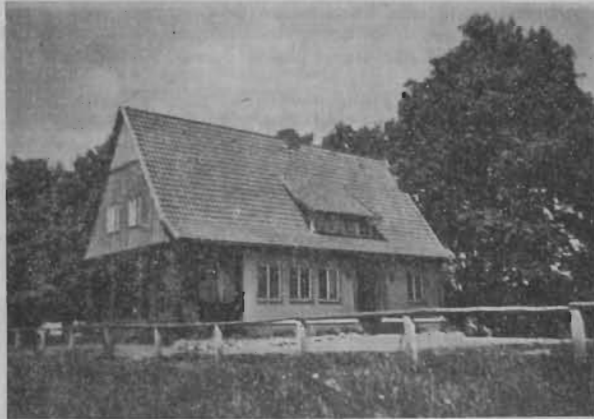
Die Jugendherberge in Fintel

Fintel ist ein freundliches und sauberes Kirchdorf am Nordwestrande der Lüne- burger Heide. Es liegt 20 km von unserer Patenstadt Rotenburg a. d. Wümme ent- fernt, abseits vom großen Verkehr, idyllisch in einer Landschaft von anmutiger