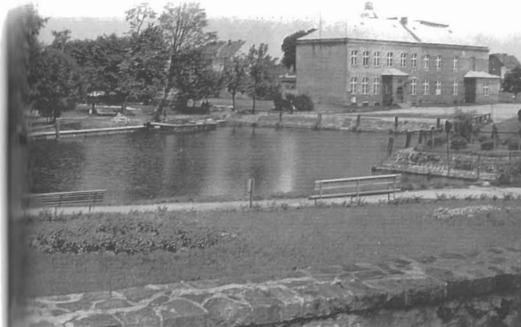
Hafen und Postamt Angerburg 1962