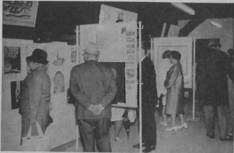
Besucher in der Ausstellung „400 Jahre Angerburg“