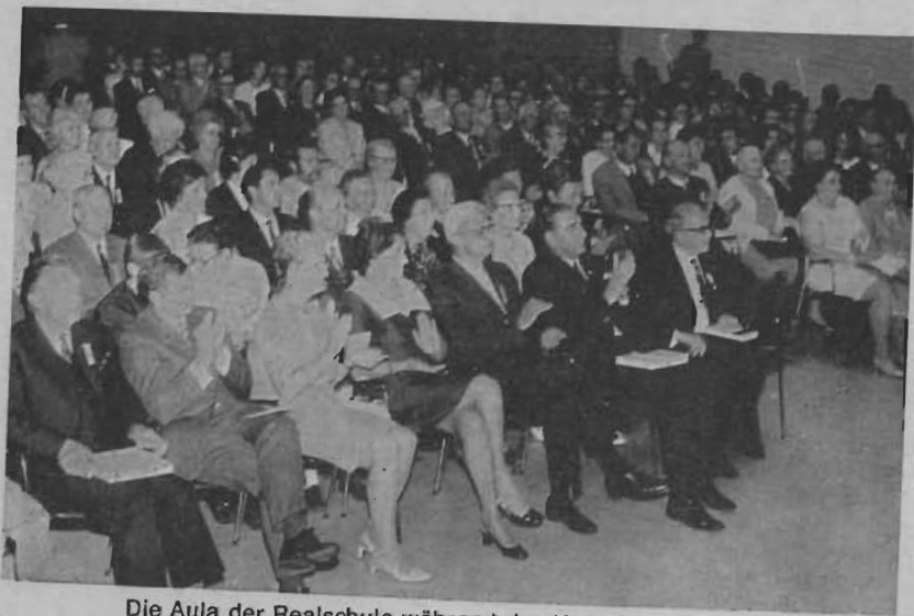
Die Aula der Realschule während des Kulturellen Abends.

nur mit Gesetzen und Entschädigungen hilft, sondern sich auch um ihre Heimat kümmert, und alle, die das ablehnen, stoßen damit nicht nur die Vertriebenen ab, sondern schaden dem ganzen Volke, indem sie die seelische Eingliederung der Vertriebenen erschweren. Solche Vorgänge, wie sie mancherorts festzustellen sind, hängen mit der Ostpolitik der gegenwärtigen Bundesregierung zusammen. Wenn ich an dieser Stelle davon spreche, so geht es nicht um die Stadt, deren Gäste wir heute sind. Aber unser Treffen ist mehr als eine lokale Angelegenheit. Unser Treffen darf nicht nur der Erinnerung an die Vergangenheit dienen, die zudem keineswegs immer so sonnig war, wie sie heute vielleicht erscheinen mag, sondern muß ein Bekenntnis sein zur Gegenwart und sagen, was wir von der Zukunft erhoffen.