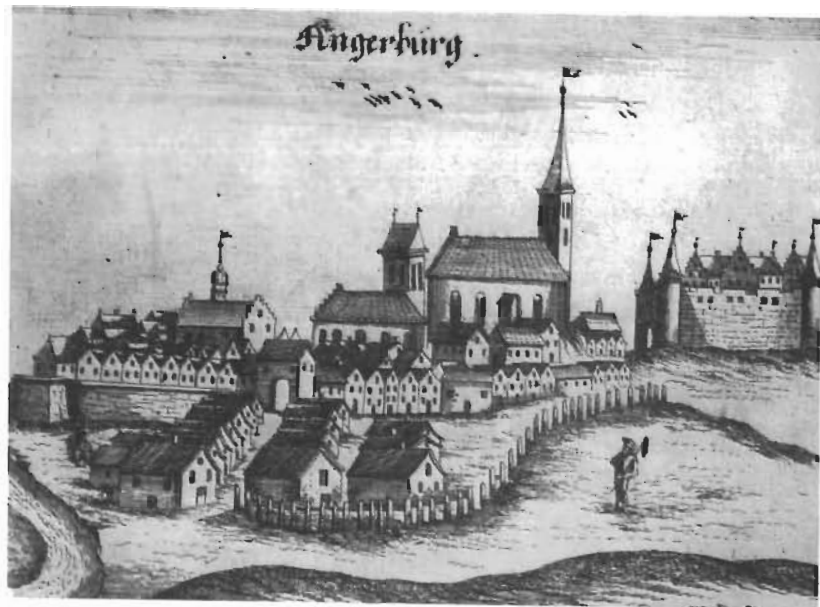
Angerburg in seinen Anfängen. Stich von Hartknoch 1684.